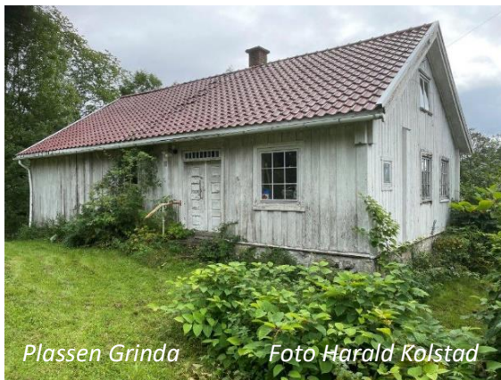
Plassen Grinda

Vi starter på sletta til Skuibakken med orientering om bakken. Derfra over Isielva forbi «Rammefabrikken» og opp langs "Dælsbekken" (Dalsbekken), med den lille fossen som går i 90gr, opp mot Berghoff. Følger så gårdsveien gjennom tunet på de tre Frognergårdene. Frogner lå under Bærum Verk fra 1664 til 1766. Vestre Frogner er i dag godt kjent for selvplukk av frukt og bær hvor hovedprioriteringen er bringebær. Vi går videre Frogner-Tandbergveien mellom jordene opp til Tanberg gård, På veien passerer vi plassen "Heia". Tanberg ble ryddet i eldre jernalder i utmarka til Berger og Frogner gård. Tanbergsaga lå nede på Årenga ved Nybrua fra ca. 1910 til ca. 1960. Busopp og Enli var husmannsplasser under Tanberg. Hos Grethe glassmester Larsen i Isigrenda tar vi en kafferast med mulighet til å grille medbrakt.