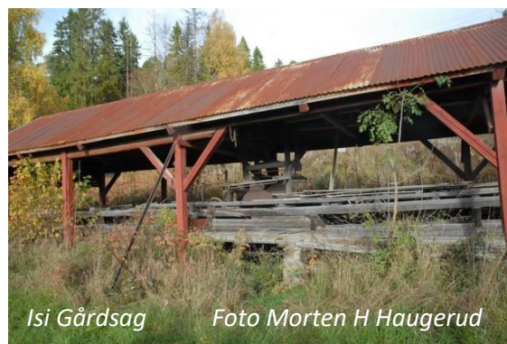
Isi Gårdsag

Vi følger Isiveien forbi Ulvegrava mot Bjørumgårdene fra yngre jernalder og skal være bosatt fra nabogården Frogner. Bjørum var en skogsgård. Bjørum hadde 16 husmannsplasser. Bjørum sag var i drift fra 1853 til 1963. Den lå ved Isielva like øst for Nypefoss bru over Rustanelva som ble sprengt under krigen 11.april 1940 av norske styrker. På Vestre Bjørum ligger Bjørumskolen, som var i bruk til 1901.