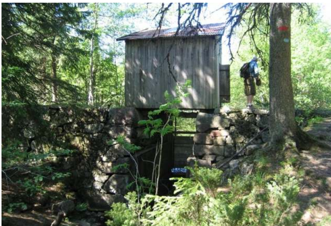
Niskinnvann demningen med hus for styring av damluke

Snart går vi over Kavlebrua og fortsetter på østsiden av elva og kommer inn i Hestehavna, forbi Ulvestua som vi kan titte innom, - og snart er vi tilbake på Skuibakkensletta.